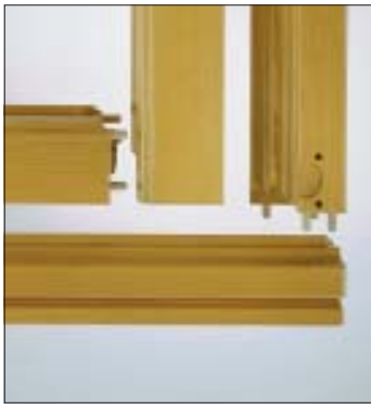
Eckverbindung mit Dübel Corner joint with dowels