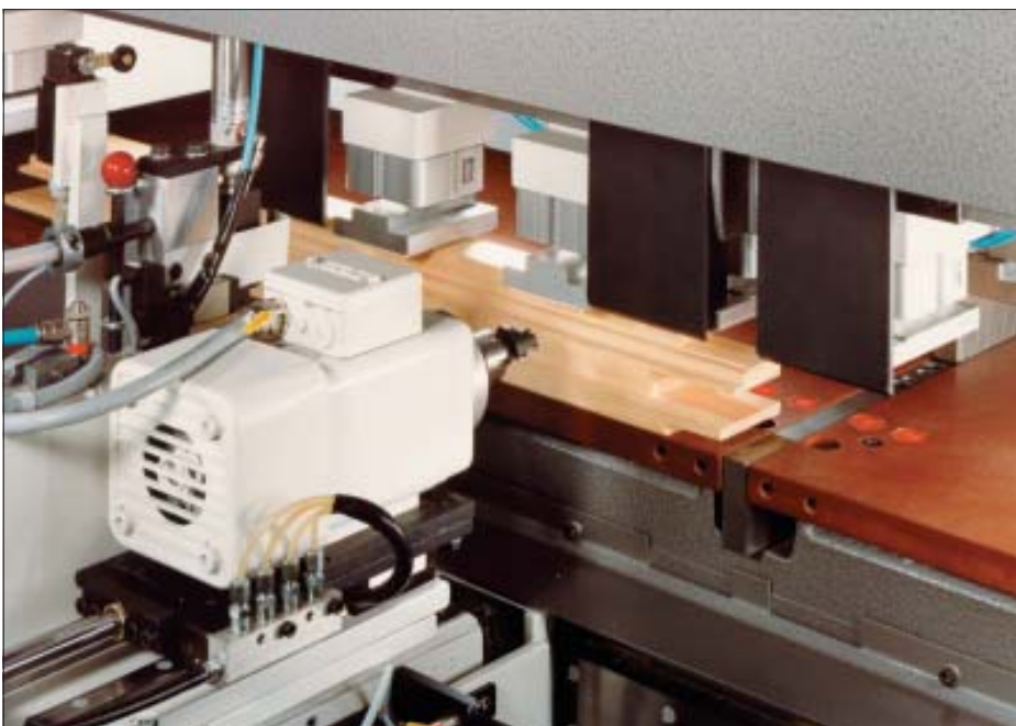
- Horizontale Fräseinheit auf ver-fahrbarem Hauptsupport für Profilwechselfräsen (nur WINDOOR)