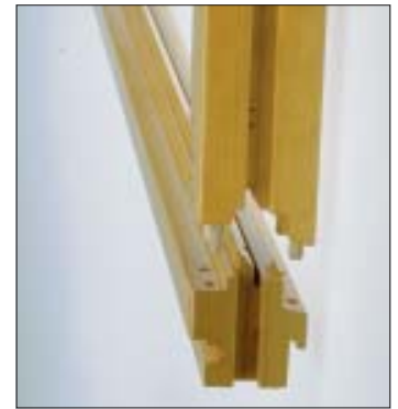
Eckverbindung Rahmen Corner joint on frame