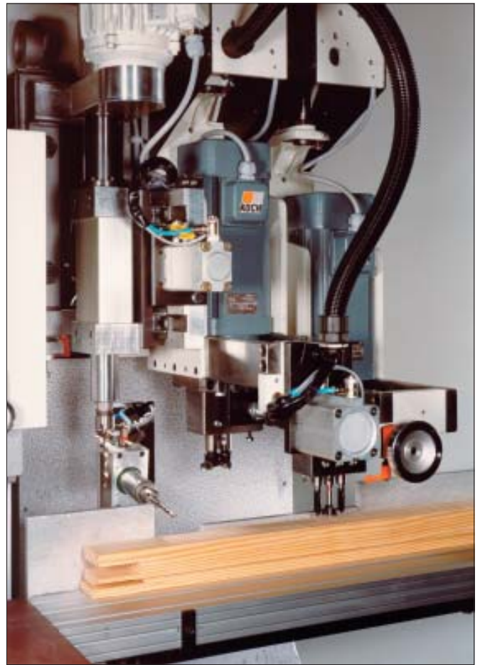
Zusätzliche Bearbeitungsstation mit: - vertikale Bohreinheit für Olivenbohrungen - vertikale Bohreinheit für Ecklagerbohrungen - vertikale Bohreinheit für Bänderbohrungen - horizontale Bohreinheit für Bänderbohrung mit fester Winkeleinstellung oder schwenkbar auf 2 Winkel