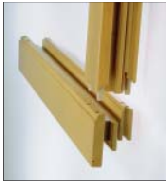
Eckverbindung Flügel Corner joint on window sash