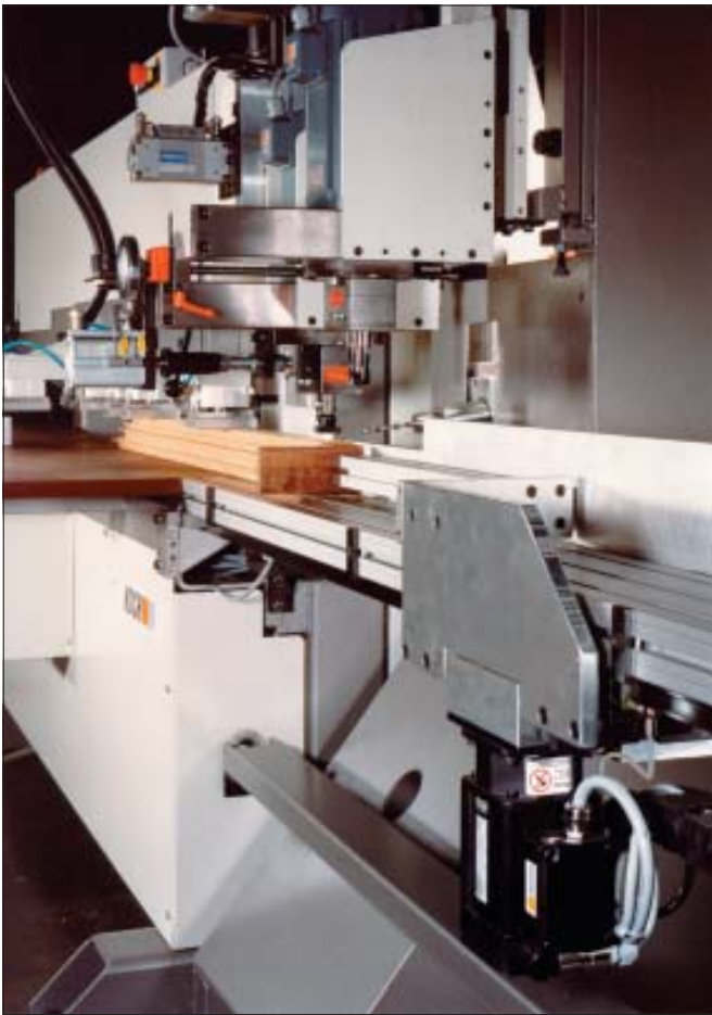
- Längsbohrereinrichtung mit NC-Positionierung für zusätzliche Bearbeitungsstationen